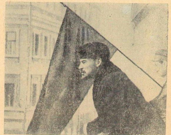
В. И. Ленин выступает с балкона Моссовета с приветствием бойцам-коммунистам, отправляющимся на борьбу с Деникиным. Москва, 16 октября 1919 года.