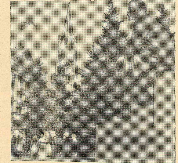
Москва. Памятник В. И. Ленину в Кремле.

библиотеке студентам нашего института. В 1975 г. только в читальном зале № 1 было выда-