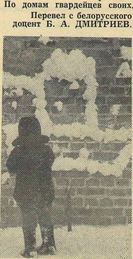
Дедушкин танк.

По домам гвардейцев своих. Перевел с белорусского доцент Б. А. ДМИТРИЕВ.