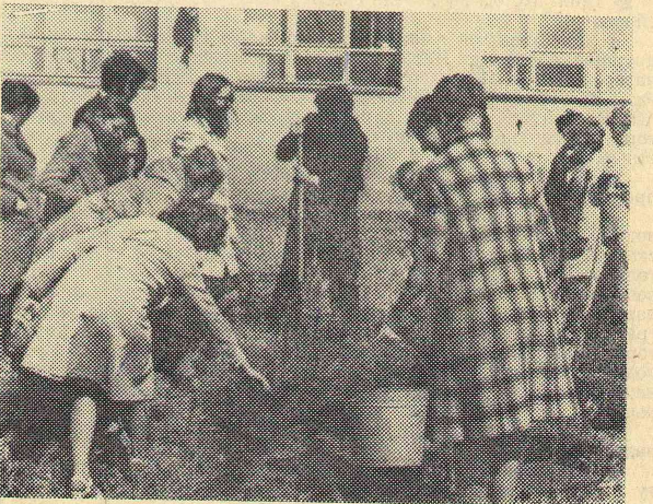
Выпускники садят аллею дружбы