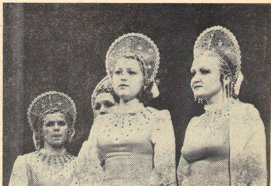
Студенческая весна-80. Поют участницы хора факультета педагогики и методики начального обучения.