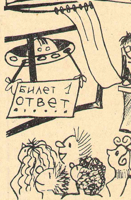
Рис. М. ШОРОХОВОЙ.