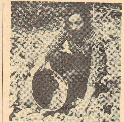
КОРМЛЕНИЕ — ЛЮБИМОЕ ЗАНЯТИЕ ЮНЫХ ПТИЦЕВОДОВ.

Закрепление полученных знаний происходит при их непосредственной работе в ученических бригадах. Ежегодно более десяти лет студенты ЕГФ после третьего курса направляются в сельские школы для руководства работой в ученических бригадах. Эта практика продолжается в течение двух недель июля. Однако при такой практике студенты не проходят весь цикл опытной работы, а охватывают только фе-