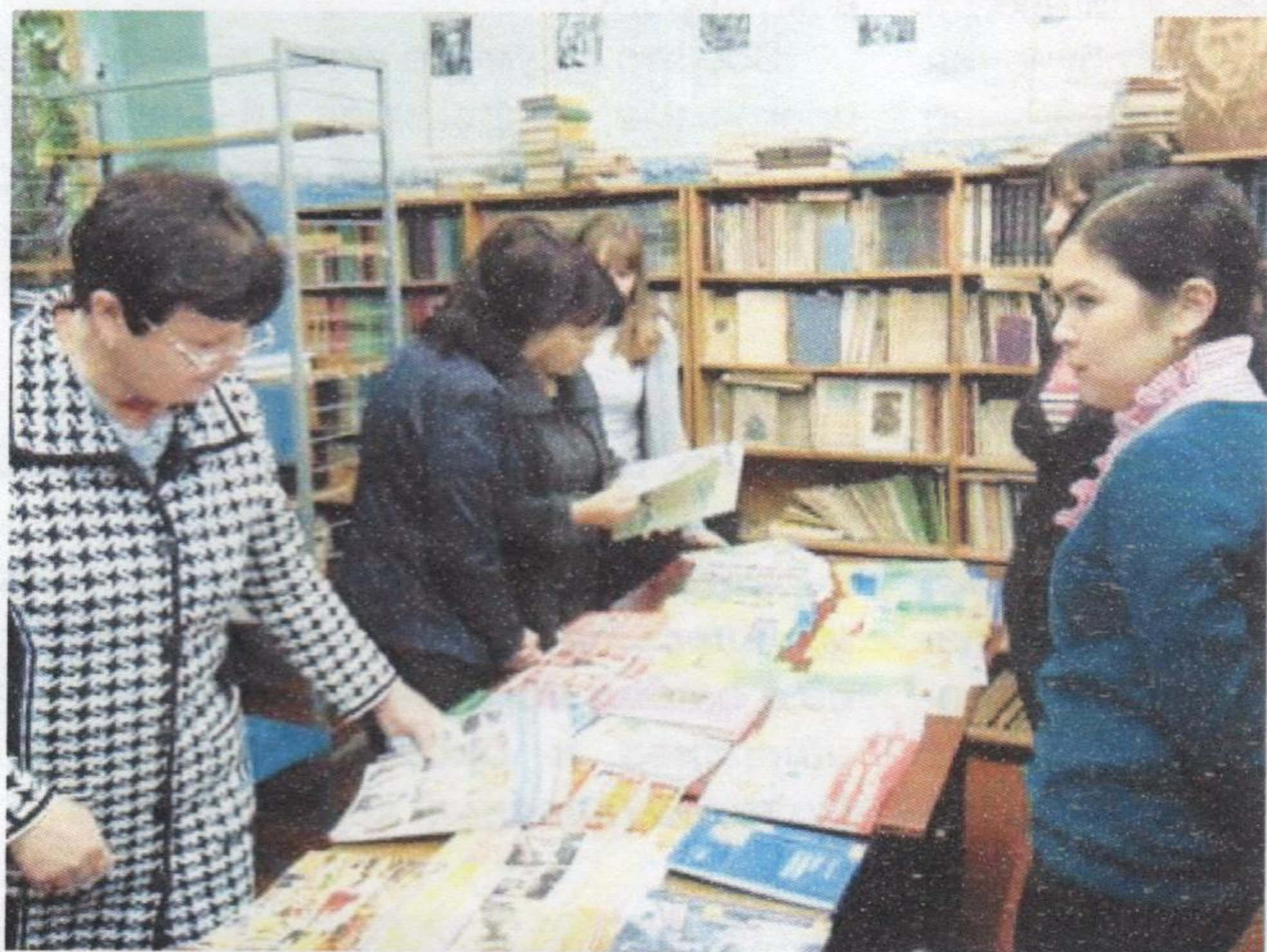
Сотрудники библиотеки филиала провели выставку тематической литературы в Междуреченской общеобразовательной школе

В результате обсуждений родилось много интересных идей по использованию лагеря. Например, преподаватели кафедры педагогики и развития образования предложили проводить в лагере выездные спортивные мероприятия, а преподаватели кафедры гуманитарных дисциплин и правоведения – художественные пленэры. Завершили выездное мероприятие дружная прогулка по осеннему сосновому бору, сбор грибов и ягод черники.