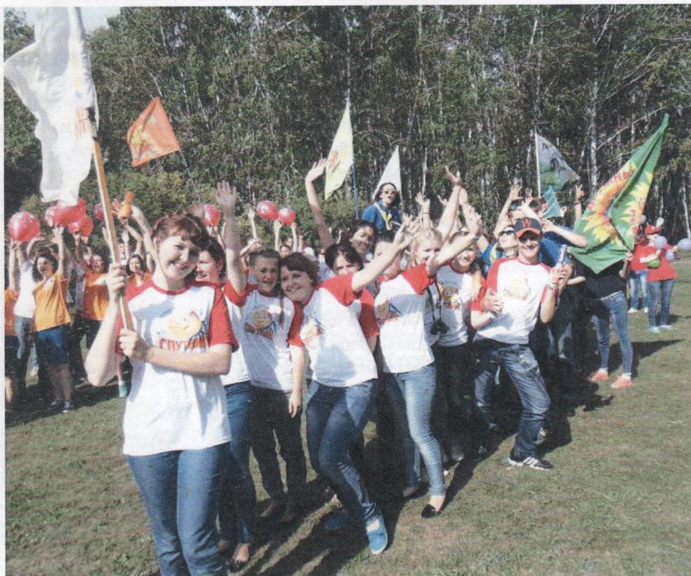
Студенты на слете вожатских отрядов «Мы вместе»