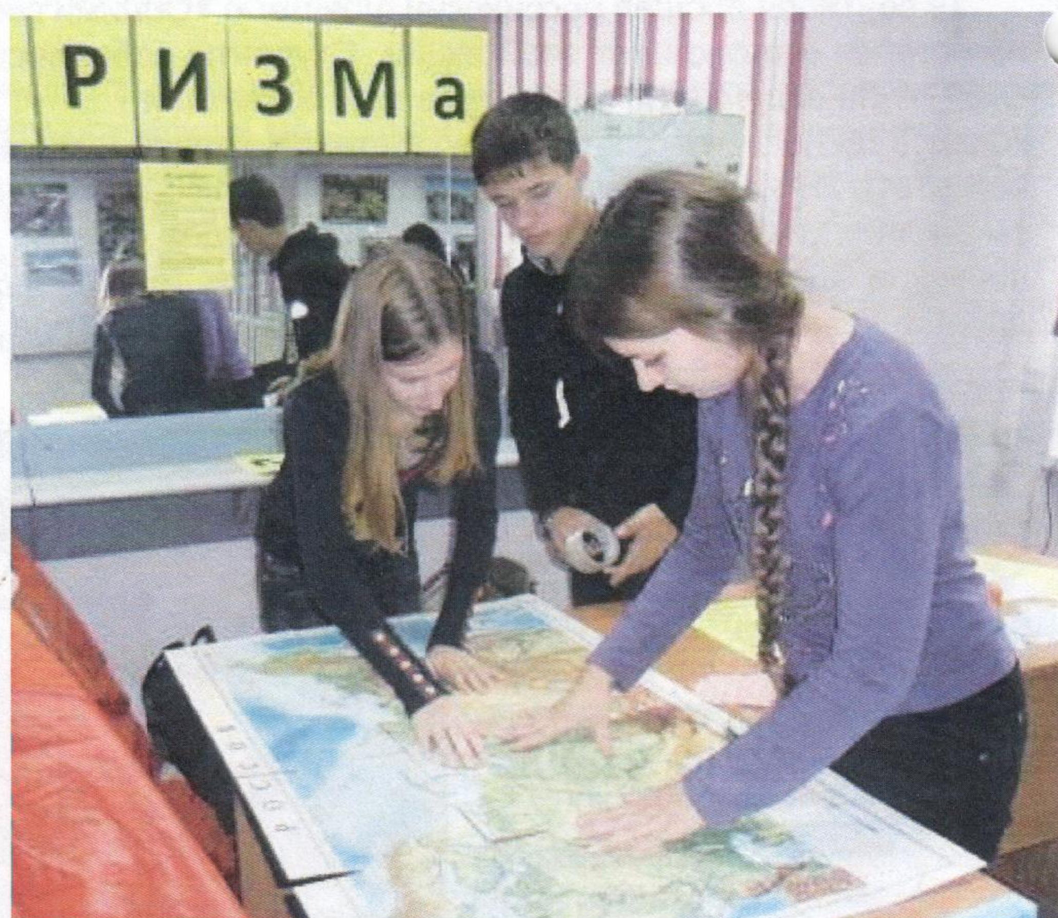
Студенты собирают «Пазл путешествий»

ОмГПУ не остался в стороне: в фойе на первом этаже студенты и преподаватели приняли участие в беспроигрышной лотерее, туристских гаданиях, сыграли в «Географическую бродилку», сложили «Пазл путешествий», сфотографировались на память возле палатки с рюкзаком. Кроме этого, загоревшись желанием путешествовать по красивейшим просторам нашей Родины студенты узнали про увлекательные путешествия, запланированные в следующем году, и записались на занятия в туристический клуб «Мечта».