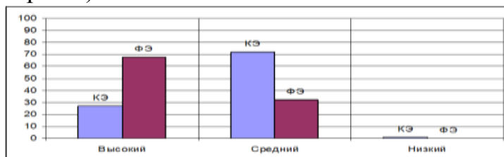
Рис.4. Динамика результатов констатирующего и формирующего экспериментов исследования ценностных ориентаций у студентов отделения «Сестринское дело» (МС) уровня выраженности поведенческого компонента эмпатии (способность к оказанию помощи) у студентов отделения «Сестринское дело» по методике А.А. Мезрабяна

Данные формирующего эксперимента опытно-экспериментальной работы свидетельствуют о том, что у студентов отделения «Сестринское дело» происходит развитие профессионально значимого качества – способность оказать реальную помощь больному, выразить сочувствие 68%, что свидетельствует о достаточно высоком уровне. Фактически речь идет о становлении профессиональных ценностных ориентаций студентов медицинского колледжа, так необходимых для успешной профессиональной деятельности (см. рис.4).